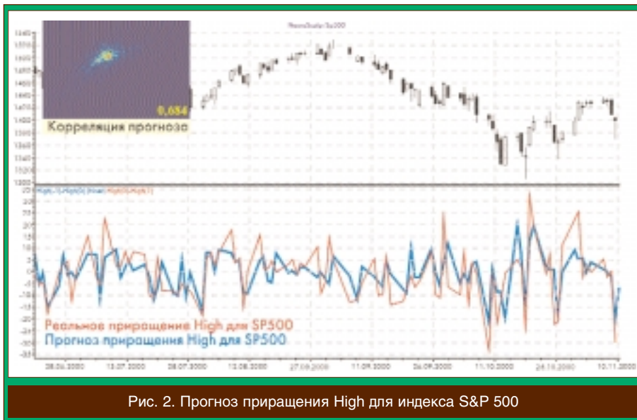
Рис. 2. Прогноз приращения High для индекса S&P 500

обучении можно использовать более «старые» данные.