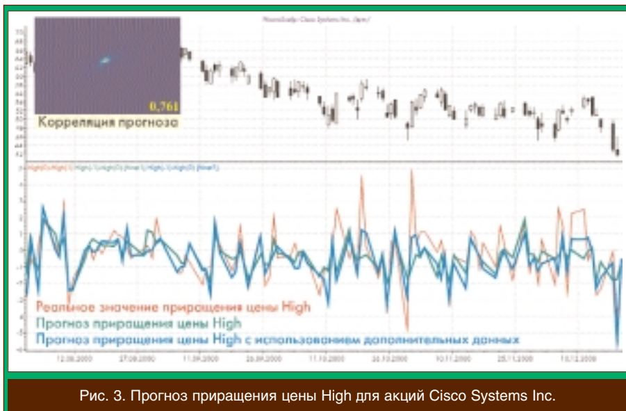
Рис. 3. Прогноз приращения цены High для акций Cisco Systems Inc.

Нейросети предоставляют пользователю уникальную возможность самостоятельной регуляции «фундаментальности» получаемых прогнозов. Если вы убеж-