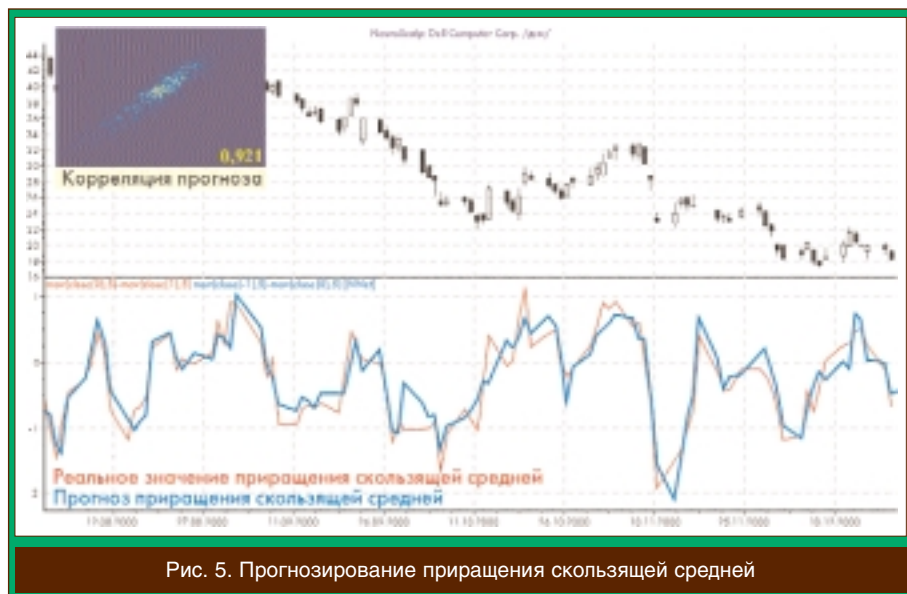
Рис. 5. Прогнозирование приращения скользящей средней

Любая МТС базируется на каком-то множестве индикаторов и торговых правилах, преобразующих эти индикаторы в сигналы покупки и продажи. Поэтому прогнозирование используемых в торговой системе индикаторов на бар вперед