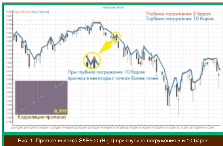
Рис. 1. Прогноз индекса S&amp;P500 (High) при глубине погружения 5 и 10 баров

зируемой величины лучше использовать в качестве выхода нейросети при прогнозировании. На эту тему в специальной литературе по финансовому прогнозированию есть многочисленные рекомендации. В основном они сводятся к следующим моментам.